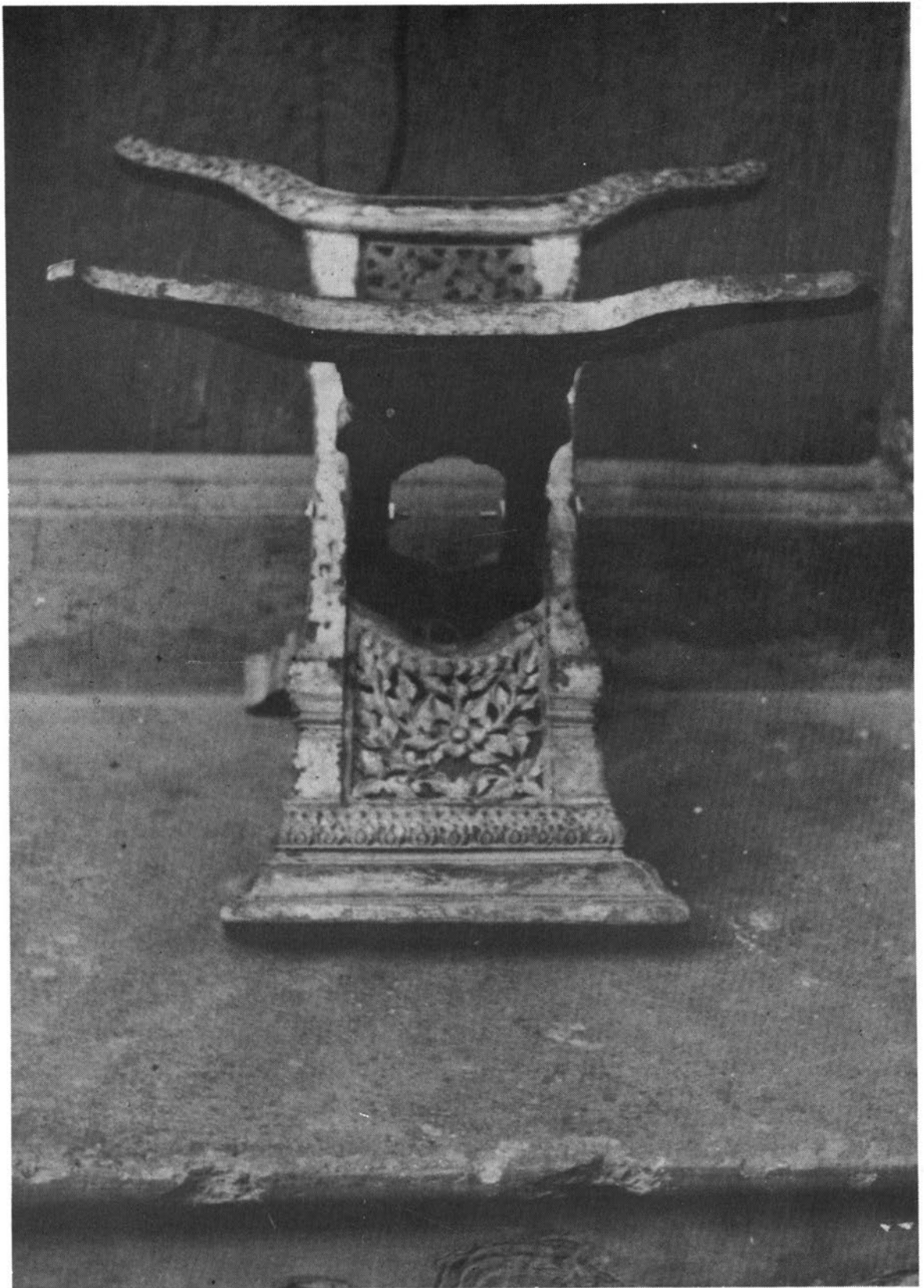
ทากะเข็ชฌมัยอชุรชชา